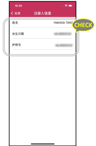
确认出生日期·护照号码（半角大写英文数字）是否正确